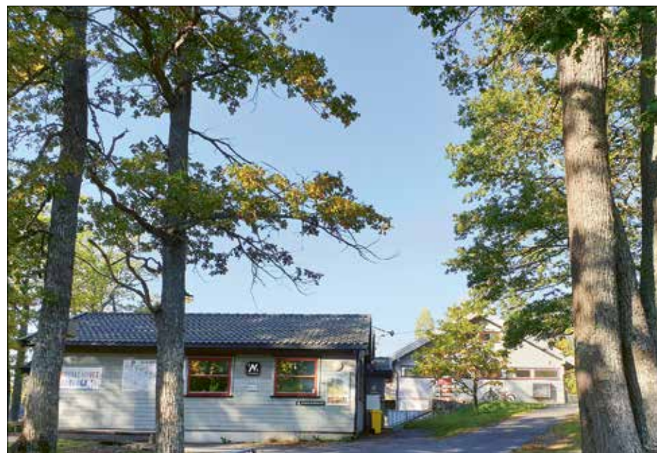
Ved Berger stadion ligger Klubbhuset (fra 1968) og Idrettshuset (fra 1991) idyllisk mellom store, gamle eiketrær.

Det var på Jaer en for alvor kom først i gang. Banen skulle bli hetende Jaerbanen. Tilførselsvei måtte opparbeides først, deretter kunne en for alvor ta fatt på selve banen som ble en ren fotballbane med grusdekke. Med iherdig dugnadsarbeid og innleid