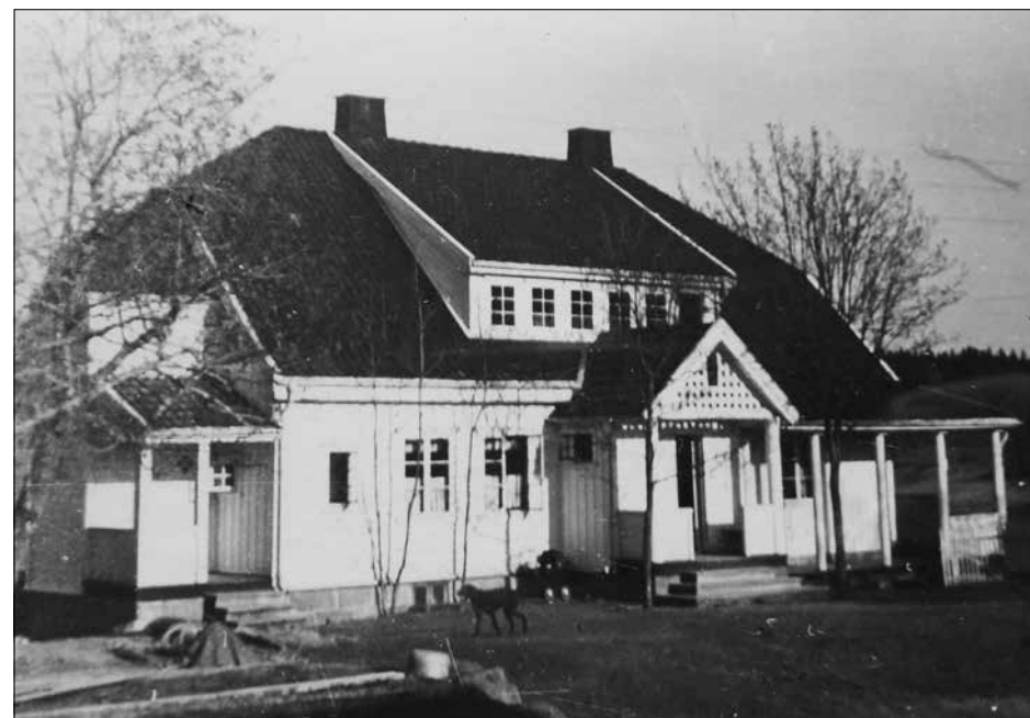
Hovedhuset på Skoklefeld østre har i vår tid blitt ungdomssenter.