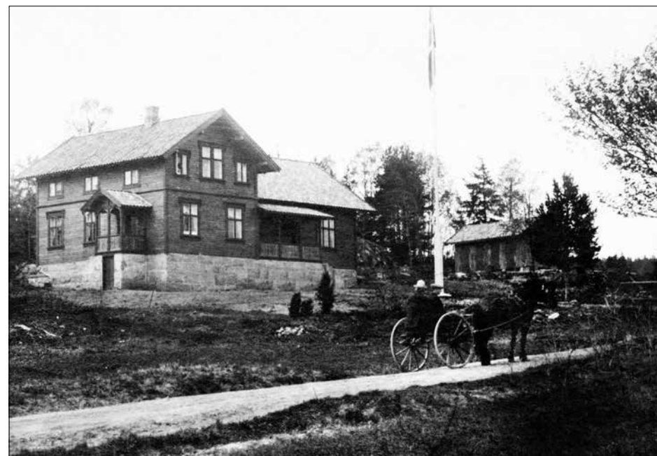
Eklund ungdomshus var Nesoddens første, og ble bygget i 1911.