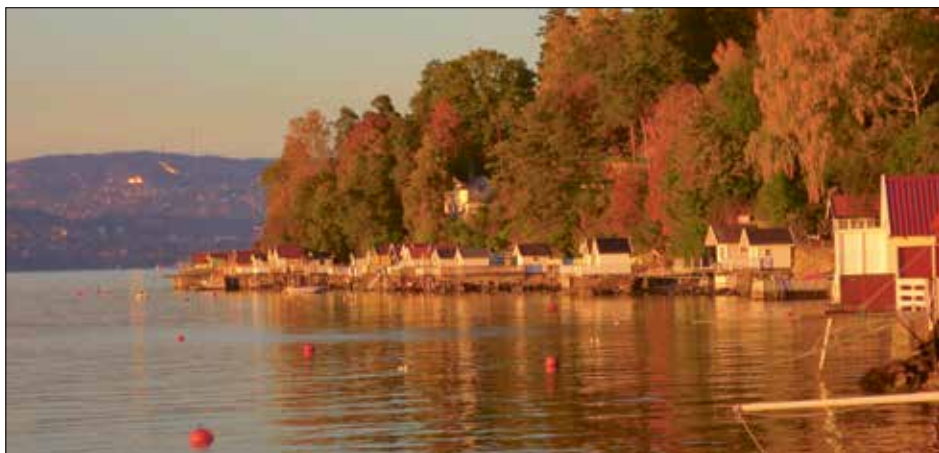
Flaskebekk med strandpromenaden.

har slike røtter, er så pass godt bevart og som er verdifullt for framtiden. Mange ønsker å bo på Flaskebekk, noe som frister til deling av tomter og fortetting. Mange synes det kan være kostbart og slitsomt å skulle sitte med en gammel eiendom som krever spesielt vedlikehold og som det er restriksjoner på. Men det er samtidig et privilegium å få være en del av historien om et slikt sted og delta i bevaringen av det. Vi som bor på Nesodden, må vite at dette området er av nasjonal interesse, vil aldri kunne gjenoppstå hvis vi ødelegger det, være stolte av det vi har her og gjøre det som er nødvendig for å ta vare på stedet og historien.