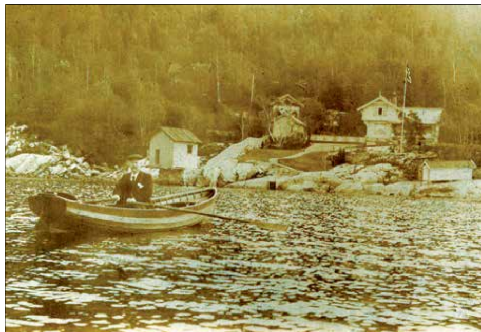
Ankomst Flaskebekk på 1800-tallet.

Landsted paa Næsodden, en lun og yndig Vig, kaldet Flaskebak. I aar, efter hvad jeg har underrettet mig om, opført flere smaa tidsmessige Huse bestemt til Salg eller Bortleie. Stedet er ualmindelig sundt, luften er en Blanding av Søluft og Skovluft. Søbadet er fortrinligt paa Grund av den stærke Strøm og langt saltere end indenfor Næsodden. En mængde Dampbaade, Skibe og Seilbaade passerer frem og tilbage hele Dagen, hvilket giver Stedet Liv uden dog at forstyrre, ellers er her roligt og ugenert. Man har de pragtfuldeste Solnedgange af Verden, naar man om Afterne lader Øiet glide hen over Askerlandet med dets Fjelde og smukke Skovlier; desuden en prægtig Udsigt og en halvfjerdings Vei opover Aasen fra en Høide, hvorfra man kan se