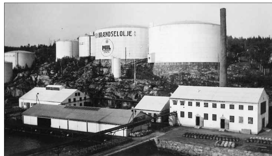
I dagligtale het Fagerstrandanlegget «MIL», som var navnet på bensinen fra Norsk Brændselolje.