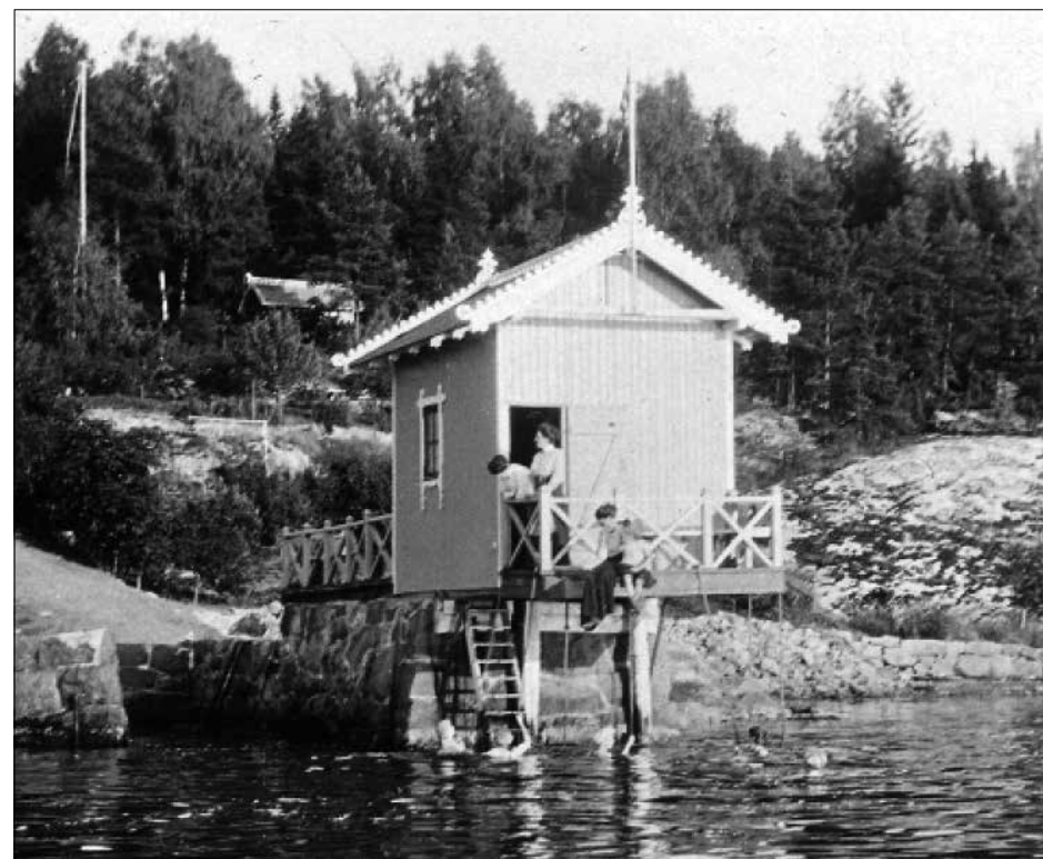
Store hager med badehus ved vannkanten.

For dem som hadde etablert seg på Flaskebekk, var det viktig å ha en viss kontroll på utvikling av området. Derfor ble det etablert en villaklausul på eiendommene. Her kunne man altså bare bygge villaer, ikke noen form for leiligheter eller småhus. Dette er nok en god del av bakgrunnen for de relativt store hus og hager som fortsatt preger området. Og man var opptatt av å ta vare på særpreget. I 1906 ble det etablert petroleumsaktivitet på Kavringen, noe man ikke ville ha noe av på Flaskebekk da man mente