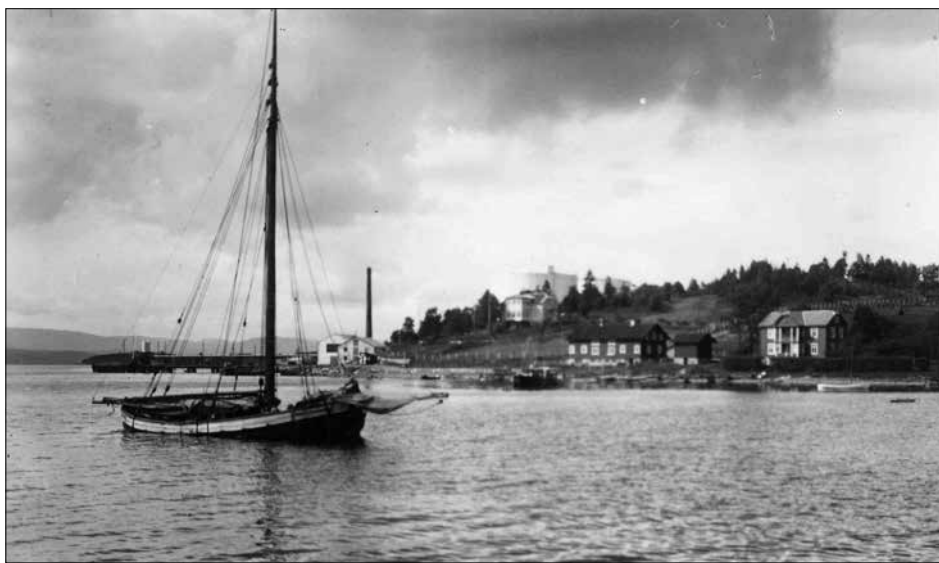
Fagerstrand på 1920-tallet: Jakten «Anni» med oljetanker i bakgrunnen.

Nesodden lå lagelig til med sin langstrakte kyststripe ut mot Oslofjorden. Fjorden var dyp nok, slik at store båter uten vanskelighet kunne komme inn til kaianlegg der, og alt lå til rette for å kunne utvikle et tankanlegg. 100 mål grunn ble kjøpt i Fagerstrand for kr. 236.000.