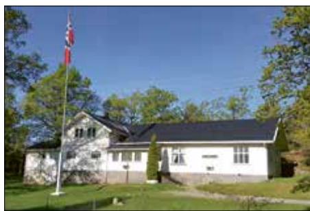
Eklund i 2019.