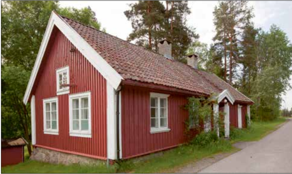
Jaerstua i 2011.