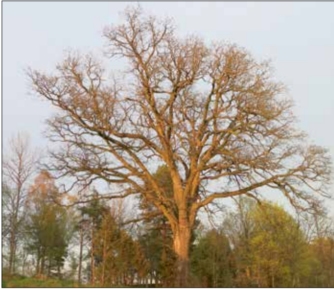
Den store karakteristiske eika ved Østre Skoklefall gård våren 2021. Dette treet er et av Nesoddens største eiketrær.