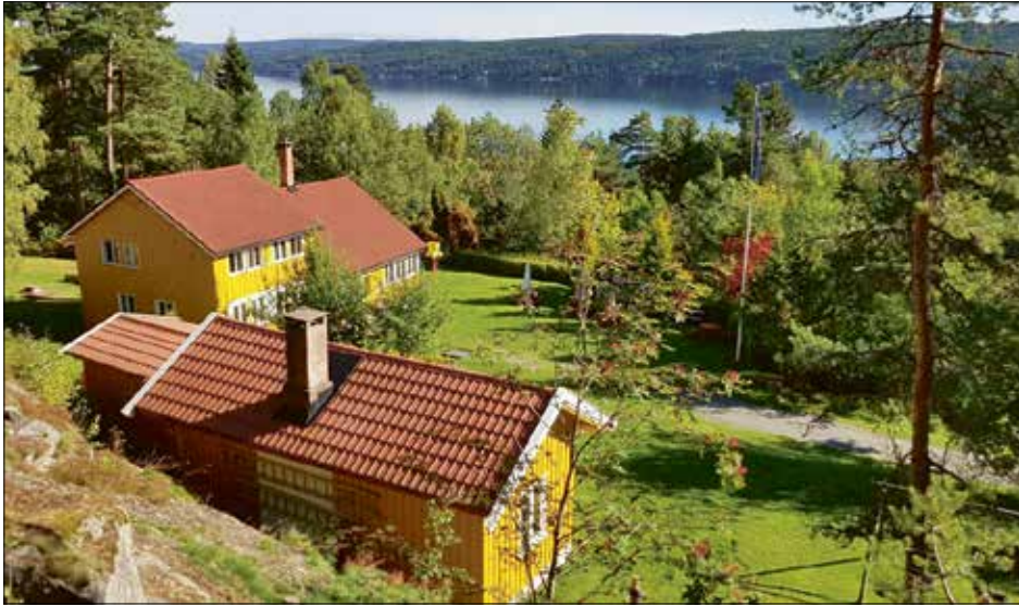
Døveforeningens feriehjem «Skaug» med flott utsikt over Bunnefjorden. 2017.

Etter disse ordskifter ble tanken lagt frem for styret i Døves Forening. Resultatet ble at en komite skulle arbeide videre med saken. Det ble avertert etter eiendommer, og det kom inn mange «billetter». Etter en besiktigelsesrunde fant man den rette, og det ble kjærlighet ved første blick. Feriehjemmet ble så innkjøpt 1. juni 1934.