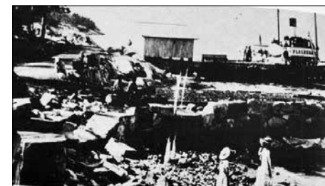
Fjellstrand brygge anno 1907. Fotograf ukjent

Fjellstrand er første gang nevnt i Bygdearkivet i 1716, da som en husmannsplass under Fjeld gård. Husmannsplassen ble senere skilt ut og fikk bruksnr. 11. Som på resten av Nesodden, bodde bønder og husmenn, datidens befolkning, naturlig nok der hvor det var dyrkbar mark. Men bøndene hadde også båter nede ved sjøen. Senere ble Fjellstrand navnet på hele området og skolekretsen.