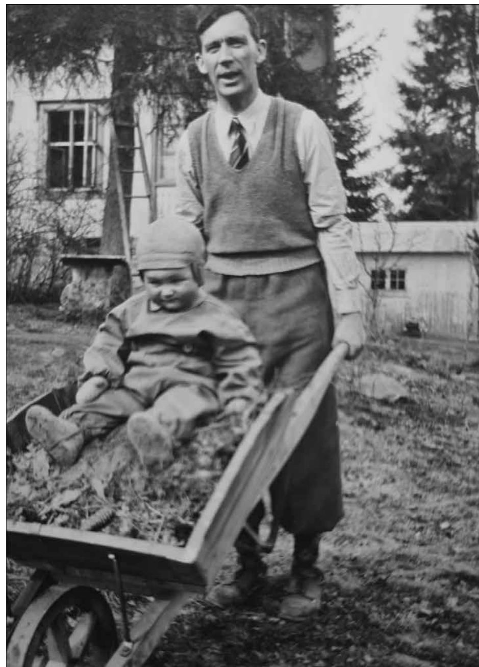
Litt familieliv ble det tid til. Doktoren med eldste sønn som ballast.

Det fantes lite eller ingenting av andre helsetjenester og sosiale tiltak i kommunen utover en knepen fattighjelp. Tuberkulose- og sykepleieforeningen henstilte ca 1920 kommunen til å bygge et gamlehjem, «til de gamles beste», ikke en fattiggård. I 1924 etablerte kommunen gamlehjem og fattiggård på øvre Gulstad. Fattighuset levde videre som betegnelse til det brant ned i 1960.