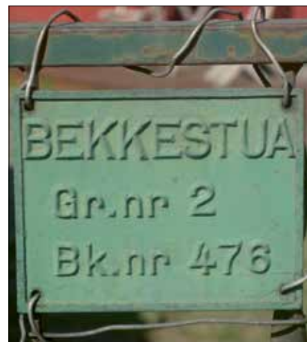
Bekkestua: Rennende naboskap.

Tradisjonelt har det vært første eier, kjøperen av den fradelte parsellen, som bestemte bruksnavnet. Dette fulgte både av skylddelingsloven fra 1909 og av den senere delingsloven fra 1978. I skylddelingsloven fra 1909 heter det: Hvert nyt bruk, som fremkommer ved skylddeling eller nyskyldlegning, bør av eieren gives særskilt navn, som anføres i forretningen.