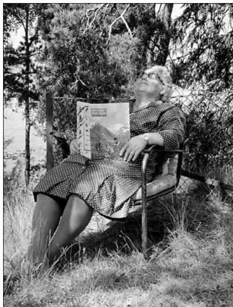
Drømmeferie på Svestad. – ferdig middag venter og ingen oppvask etterpå.

Det ble sju kvinneforinger i Oslo Arbeiderparti som sto for drift av dette idylliske ferie-hjemmet. Vedlikehold, vask og stell av eien-