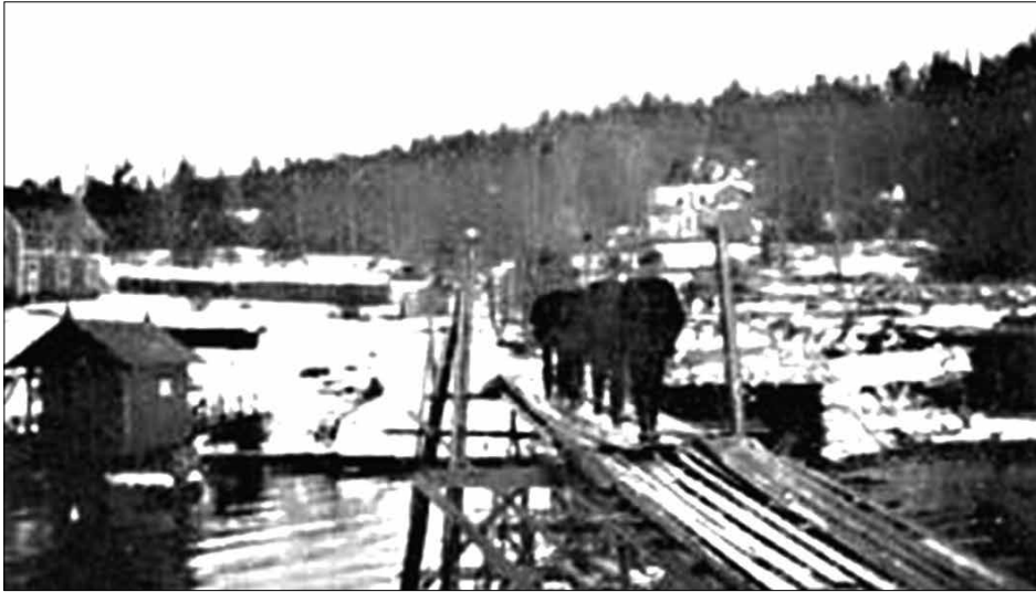
Isarbeidere skli isen fra ishusene på Oksval ut til ventende isskuter. Isblokkene ble sklidd ut på brede planker som lå på høye pæler. Pælene sto stødig bl.a. i fordypningene i skjæret på badestranden. Pælene måtte være høye for at blokkene skulle skli nedover og helt ut til isskutene som lå lenger ute. Der ble de tippet over båtripene, og styrt ned i lasterommene.

aktuelle tjern, til spottpris. Og bøndene forsto knapt hva som skjedde. Men Parr visste hva han gjorde.