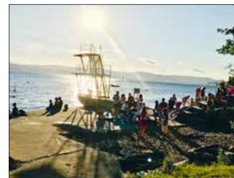
St.Hans-feiring i Paradisbukta 1995.