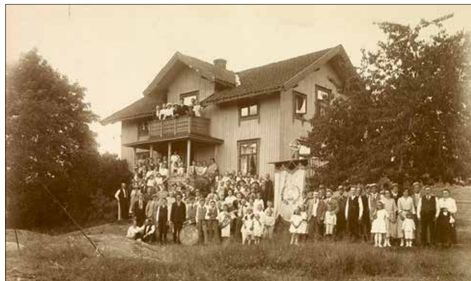
Innvielse av skreddersvennenes feriehem «Bjørgan». 1921.

I 1985 arvet Norsk Folkehjelp stedet, og i 1989 fikk de pengene fra salget av «Bellevue» til understøttelse av eldre og barn i Oslo, som ikke hadde et ferietilbud, som de nå skulle få på «Furukollen». Det var primært familier med lav inntekt som fikk en ferie på Svestad. Fra 2015 har Oasen – «kvinner krysser grenser», som er et inkluderings-program underlagt Norsk Folkehjelp, Oslo arrangert sommer-ferie for familier med innvandrere-bakgrunn på