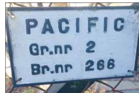
Pacific: Stillhet på Flaskebekk.

Det kan se ut som det var mer eller mindre obligatorisk å registrere bruksnavn i matrikkelen frem til skylddelingsloven ble erstattet med delingsloven i 1980. Men dette vet vi ikke sikkert. Eierne kunne lage eller velge et navn selv, men enkelte kommuner hadde lister med forslag som eierne kunne velge mellom dersom de ikke fant på noe selv. Dette kjenner vi ikke til om var tilfelle på Nesodden. Bruksnavnet inngår normalt ikke i eiendommens offisielle adresse. Etter 1980 er det kun sporadisk at nye eiendommer gis bruksnavn, men det er fremdeles en mulighet eieren har.