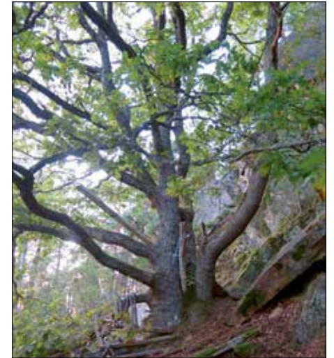
I overkant av rasmarker på Nesodden kan det stå enkelte grove eik. Denne kjempen står i en rasmark ved Ommen. Til tross for at treet er svært utilgjengelig, har noen har forsøkt å bygge et arrangement i treet, og en rusten sag henger på en avkappet grein.

Eik i ulike alder er har ulike fauna og flora knyttet til seg. På yngre trær er det først og fremst bladene som blir spist av en rekke insekter, f.eks. sommerfugler og biller. Etter hvert som treet blir eldre, får det også grovere og grovere bark. Gamle eiketrær