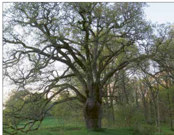
Den store eika ved Røer gård, er trolig Nesoddens eldste eiketree, med en antatt alder på mer enn 500 år. Treet har betydelige hullbiter. Bildet er tatt våren 2021.

Det eldste eiketreet på Nesodden er trolig et tre i tilknytning til Røer gård. Her står en hul gammel vidkronet eik med en omkrets på nærmere