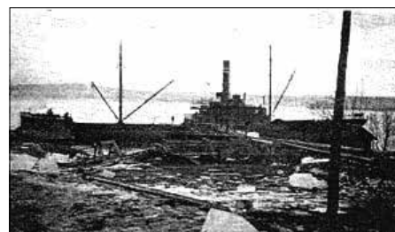
Isbåt ved Oksval brygge.

Og interessant for oss i Norge: Mat måtte fraktes over store avstander og lagres før den kom fram til folk flest. Melka ble sur, og fisk, kjøtt, grønnsaker og annen