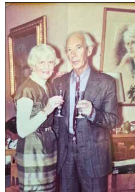
Gullbrudepar.